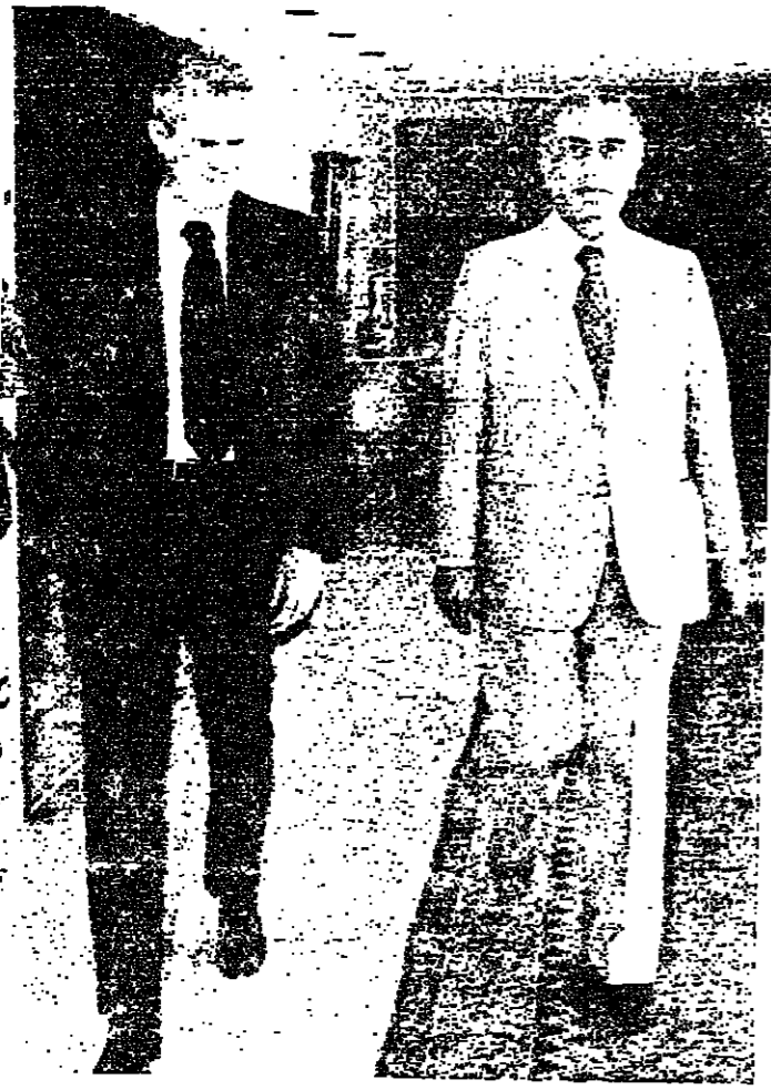
الرئيس سركيس والوزير فانس في الطريق الى الخلوّة